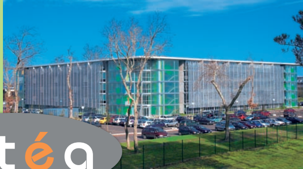
Domaine James Watt à Mérignac